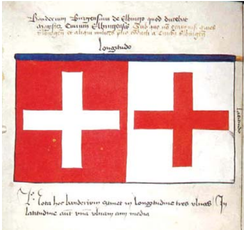
Stare Miasto Elbląg.