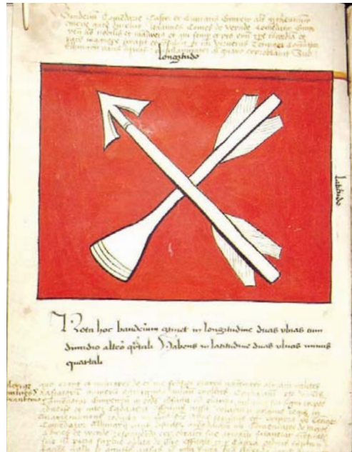
Rzekoma chorągiew gniewska

ma białymi, przekrzyżowanymi ukośnie strzałami, jedną ostrą, drugą tępa (drewniana – do polowania na małe ptaki).