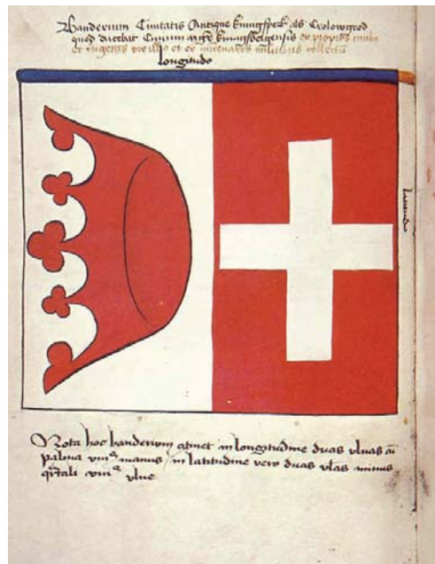
Stare Miasto Królewiec.